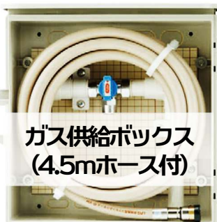
ガス供給ボックス (4.5mホース付)

さらに、ガス供給ボックス+エンジンオイルセット (26,235円分) を LINEクーポンでプレゼントします！ (防災キャンペーン中のみ)