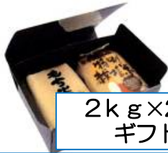
2kg x 2本 ギフト